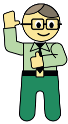
ALFA Smart Agro